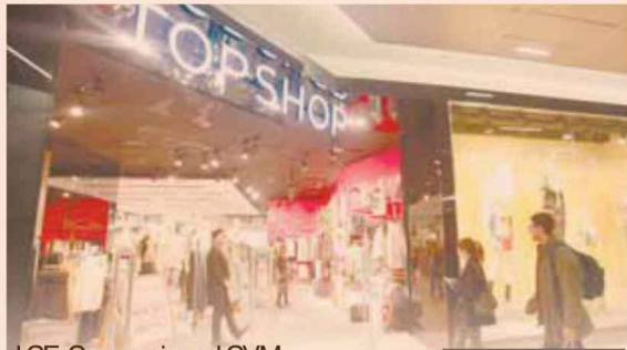
ICE Comercio e ICVM