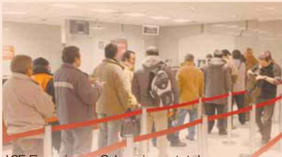
ICE Financiero y Colocaciones totales