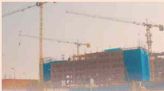
ICE Construcción e Imacon