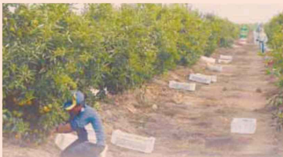
ICE Agrícola y tipo de cambio nominal