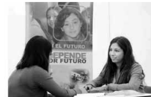
El objetivo es acercar a los estudiantes al mundo laboral.