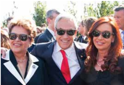
Cumbre CELAC-UE 2012. Presidentes con Karün

De esta manera, fue que los alumnos tuvieron la oportunidad de dedicarle horas académicas del Programa de Co-Educación a sus propios emprendimientos y de compartir sus experiencias en el mundo de la innovación.