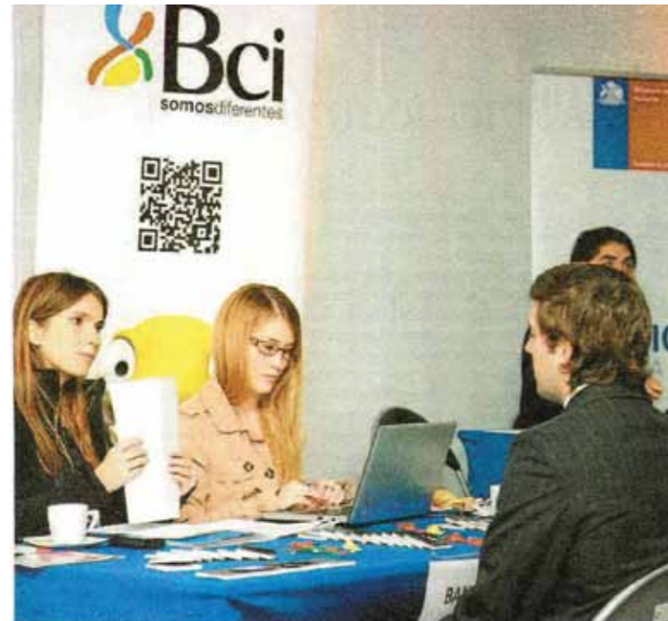
▲▲ Los alumnos de la UDD tuvieron entrevistas laborales con 25 empresas.