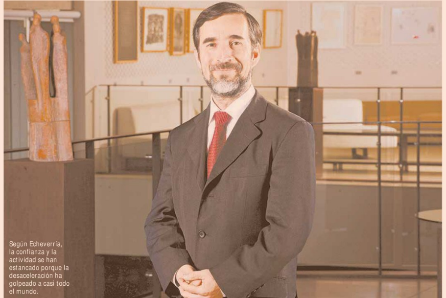
Según Echeverría, la confianza y la actividad se han estancado porque la desaceleración ha golpeado a casi todo el mundo.

- Nuestras series muestran que la caída en la confianza está a mitad de camino de lo que fue el retroceso en la crisis subprime, y en ese sentido discrepamos de la medición que hace, por ejemplo, Adimark. Nuestra medición está mucho más en concordancia con la situación