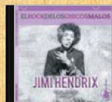
Jimi Hendrix Ya en kioscos