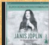
Janis Joplin Ya en kioscos

ENCUÉNTRALOS EN KIOSCOS TODOS LOS MIÉRCOLES A SÓLO $2.490