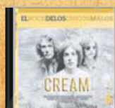
Cream 5 de mayo