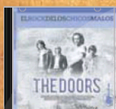
The Doors 28 de abril