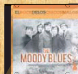
The Moody Blues 12 de mayo

(Regímenes XV, I, II, XI y XII $2.890) Promoción válida hasta agotar stock de 4000 unidades. Las Fechas pueden estar sujetas a cambio sin previo aviso.