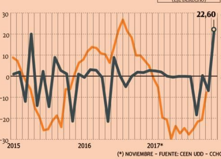
(* NOVIEMBRE - FUENTE: CEEN UDD - CCHC