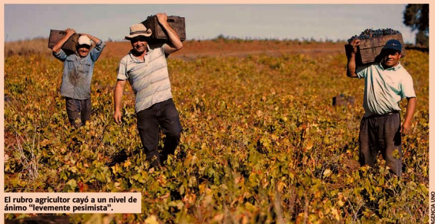
El rubro agricultor cayó a un nivel de ánimo "levemente pesimista".

20,4 puntos cayó la confianza en el sector agrícola.