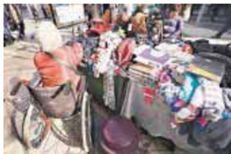
Trabajador con discapacidad.

licita que las personas en situación de discapacidad que hayan cursado educación especial, sean admitidas para postular a vacantes del Estado, ya que hoy se exige haber cursado mínimo enseñanza media. Otro tema es que las empresas que tienen contratadas a personas con discapacidad puedan celebrar un número limitado de contra-