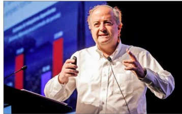
El ministro del Trabajo, Nicolás Monckeberg, cuestionó ayer en el foro de la CCS el proyecto de las diputadas del PC Camila Vallejo y Karol Carola.

**Descartando de la jornada media hora de colación. **Descartando una hora de colación.