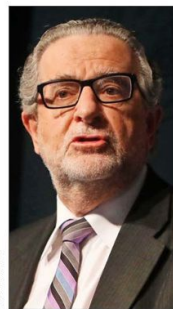
JORGE RODRÍGUEZ EXMINISTRO DE ECONOMÍA

“El principal problema que tiene nuestro país es el de una muy desigual distribución de ingresos y una excesiva concentración económica”.